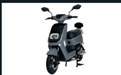
NERO OPACO GRIGIO SIDERALE